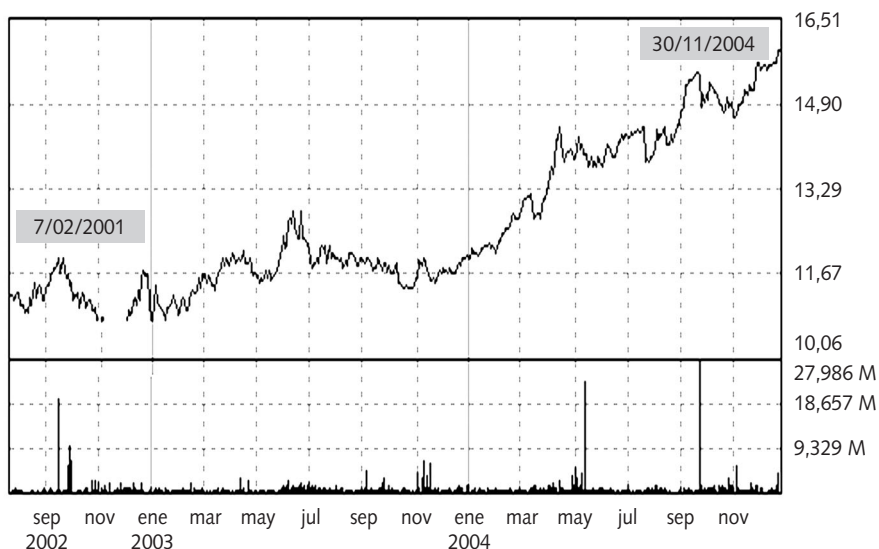
Figura 4. Gráfico de la cotización en bolsa de las acciones de la web de la AEPap.