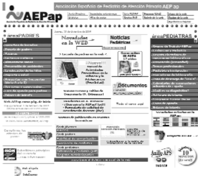
Figura 1. Página inicial de la web de la AEPap.

La sección de información para padres y adolescentes cumple con creces, a juzgar por el número de visitas y el de otros sitios webs que enlazan con ella, su objetivo de ofrecer al público información de interés sobre la crianza de los