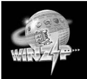
Figura 1. Logotipo de Winzip

con la extensión zip (u otras) que contienen él o los archivos que nosotros hemos incluido. Son muy útiles para conseguir, por ejemplo, que archivos algo mayores de la capacidad de un disquete (1,44 MB) puedan ser copiados en un disco, para liberar algo de espacio en nuestros discos duros, etc. El estándar es el programa Winzip (figura 1), cuya versión más actual, la 8.0, está disponible como shareware con 21 días de periodo de evaluación y con algunos recortes en sus prestaciones, aunque después de ese tiempo podemos seguir usándolo (a partir de ese día nos recomienda que nos registremos). El manejo del programa puede parecer inicialmente algo complicado, sobre todo porque está en inglés –no sabemos que haya versión oficial en español–, pero con un poco de paciencia pronto aprovecharemos al máximo sus posibilidades.