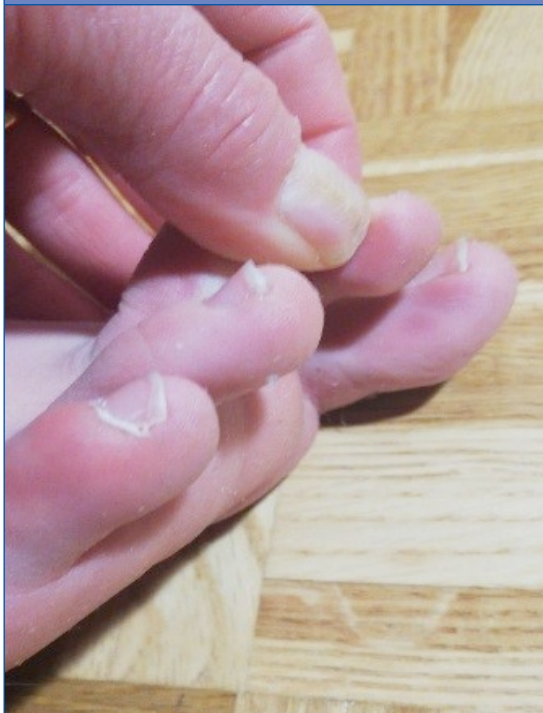
Figura 2. Acroisquemia por COVID-19. Caso 1, varón de 12 años, día 1