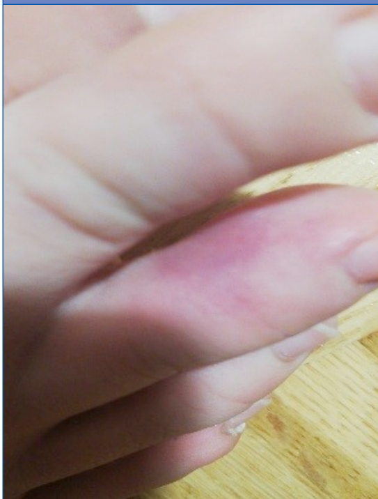
Figura 1. Acroisquemia por COVID-19. Caso 1, varón de 12 años, día 1