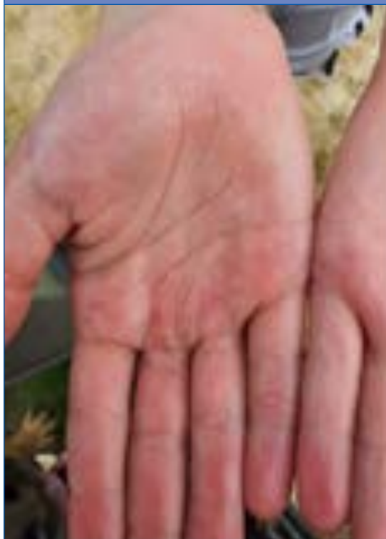
Figura 6. Acroisquemia por COVID-19. Caso 2, varón de 12 años, día 1