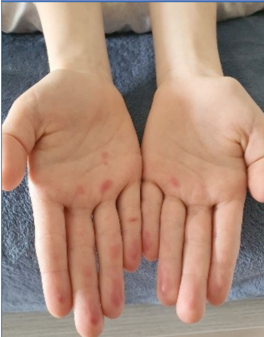
Figura 8. Acroisquemia por COVID-19. Caso 2, varón de 12 años, día 2