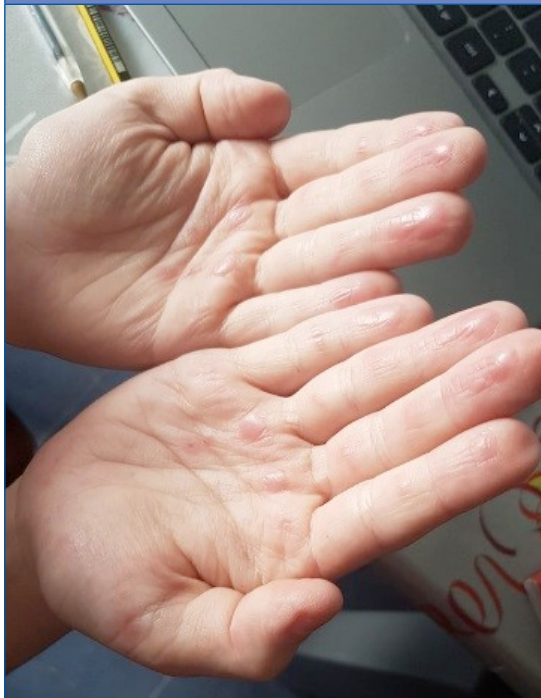
Figura 9. Acroisquemia por COVID-19. Caso 2, varón de 12 años, día 7