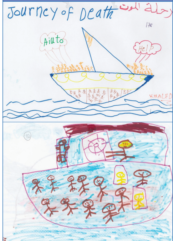
Figura 6. Dibujos de experiencias vividas en el viaje