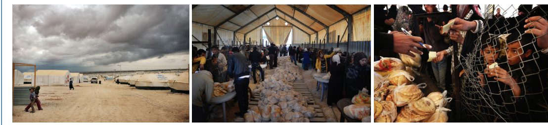
Figura 1. Campo de refugiados de Zaatari

Lo siguiente que nos cuentan siempre es que no entienden por qué ha ocurrido esta guerra.