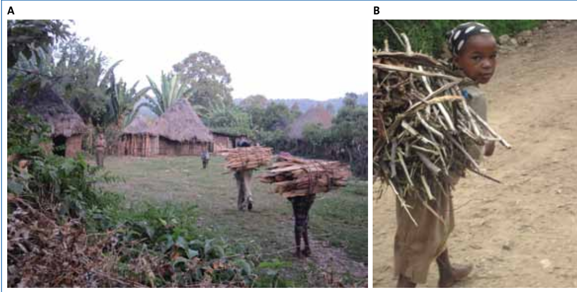
Figura 4. Pobreza en Etiopía. A: Viviendas de adobe y paja sin agua ni electricidad. B: Trabajo infantil