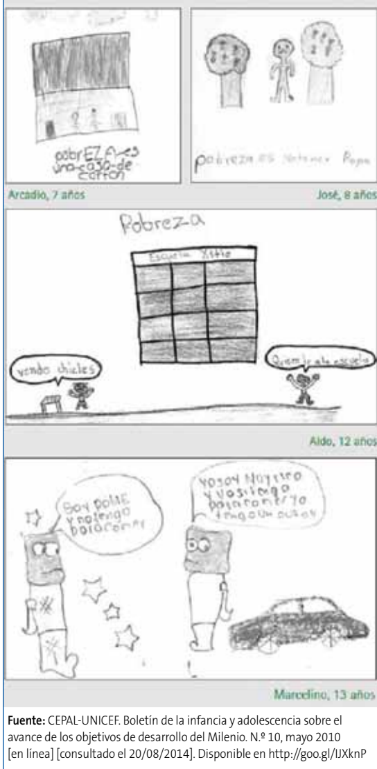
Figura 1. La pobreza según los niños

presarse libremente sobre los temas que los afectan y a que sus opiniones se tomen con seriedad.