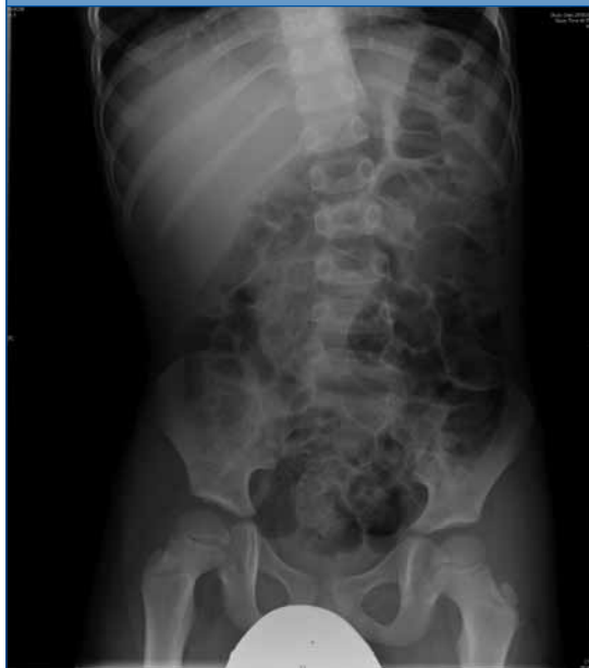
Figura 1. Radiografía simple abdominopélvica. Escoliosis antiálgica y abundantes restos fecales en marco cólico

magrafía ósea, la cual se llevó a cabo en los siguientes días, con resultados negativos.