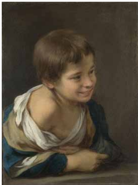
Niño riendo asomado a la ventana , 1675. Bartolomé Esteban Murillo (1617-1682). The National Gallery. Londres. Reino Unido.

Con este y otros cuadros de temática libre, el de Sevilla pasa del encasillamiento eclesiástico al terreno de lo independiente, hecho inusual en la época y que convierte a Murillo en uno de nuestros genios.