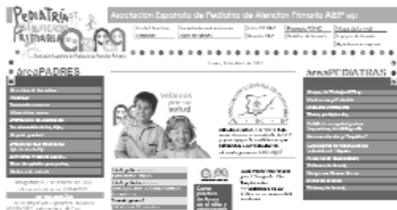
Figura 1. http://www.aepap.org/

La página de la Asociación Española de Pediatría de Atención Primaria (AEPap) es una dirección de obligada visita por los pediatras hispanohablantes (Figura 1). Inaugurada en febrero de este año, aunque todavía muy jovencita, reúne gran cantidad de información actualizada y di-