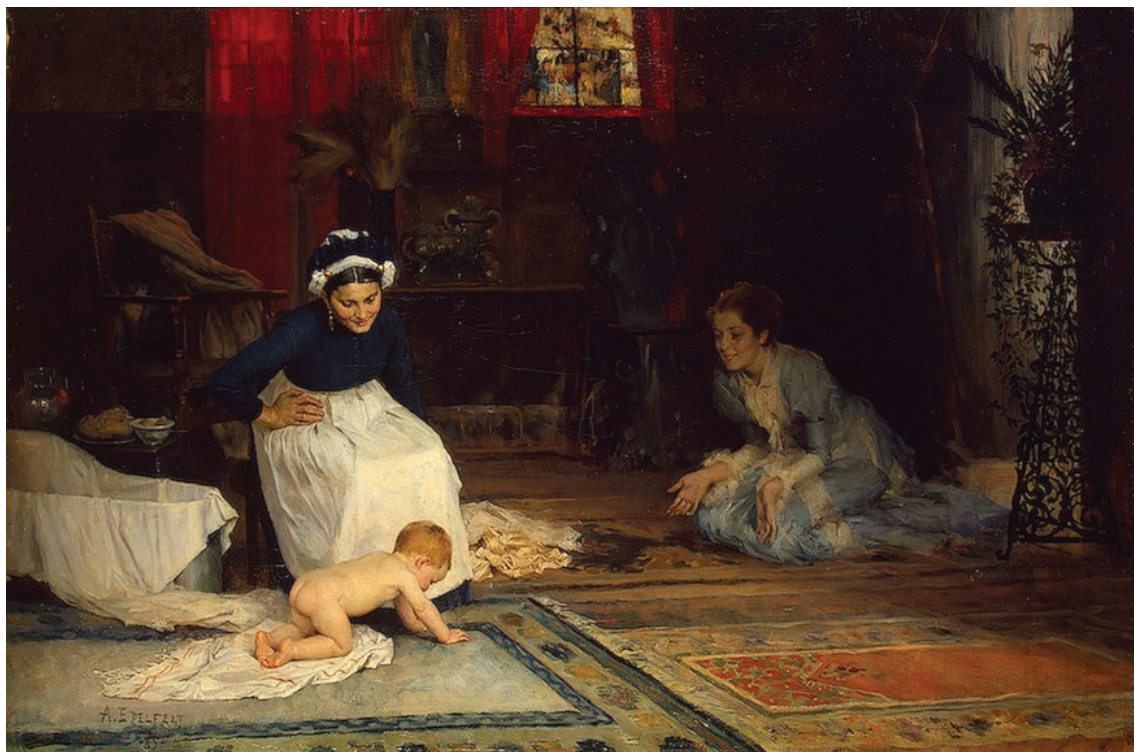
In the nursery , 1885. Albert Edelfelt (1854-1905). Hermittage Museum. San Petersburgo. Rusia.

Pese a su amistad con el poeta épico Johan Ludvig Runeberg, se consolidó internacionalmente gracias a un elegante estilo realista marcado por el refinamiento cromático y el minucioso tratamiento de los detalles. En este cuadro podemos comprobarlo. Destaquemos que, más allá de lo suntuoso de la habitación, los auténticos protagonistas de la estampa son el gateo del pequeño y los gestos de alegría y ternura despertados en las dos mujeres (mamá y doncella) que asisten al espectáculo. Independientemente de su nivel adquisitivo, ambas se unen a través de esa felicidad elemental.