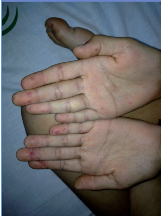
Figura 3. Hallazgos en la exploración física: lesiones purpúricas en los pulpejos de las manos, los pies y los talones