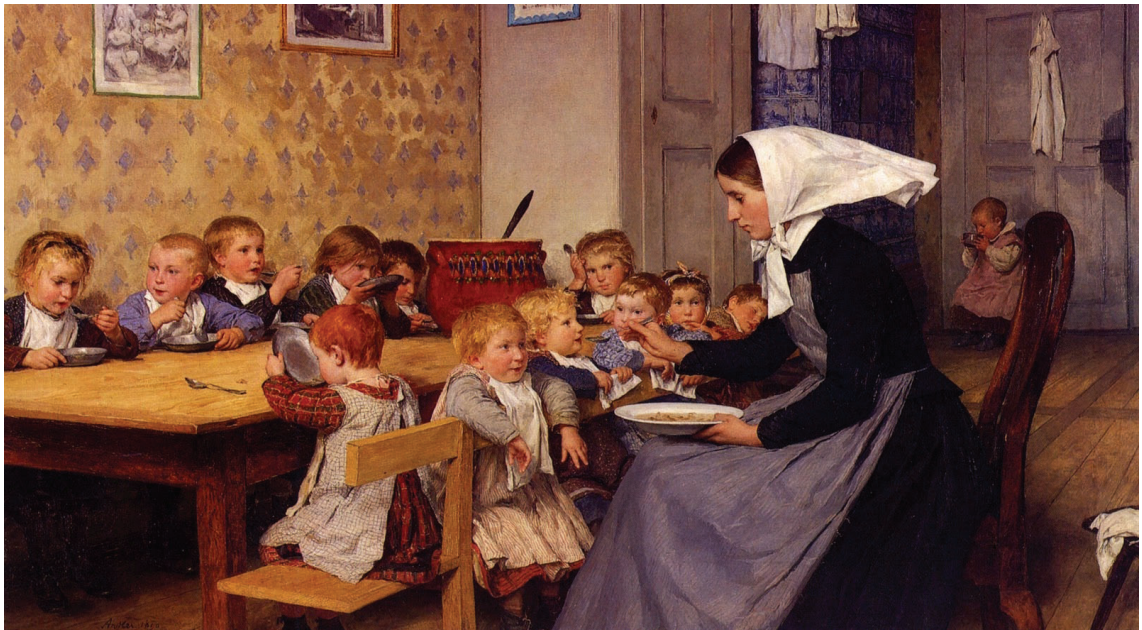
The Crèche , 1860. Albert Samuel Anker (1831-1910). Museum Oskar Reinhart am Stadtgarten. Winterthur. Suiza.

En este cuadro vemos a un grupo de compañeros de guardería con su cuidadora, en el esperado/denostado momento de la comida. La glotonería adquiere distintas formas: desde la voracidad de la niña pelirroja en primer plano, que apura la sopa directamente desde el plato, sin cubierto que medie, hasta el alimentado por el sueño (inmediatamente por encima del brazo derecho de la cuidadora).